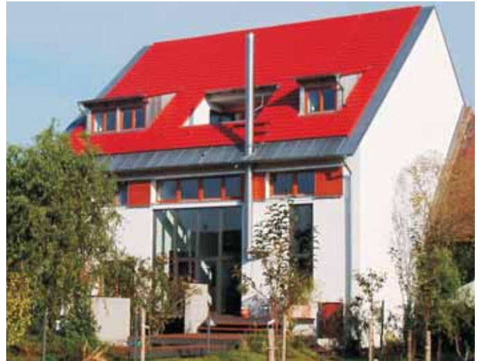
Nachher: Ein großzügiges Wohnhaus mit Galerien, Dachloggia, Glasfassaden und Schwimmbereich. Zeit- und Kostenrahmen für BJA wurden natürlich eingehalten.