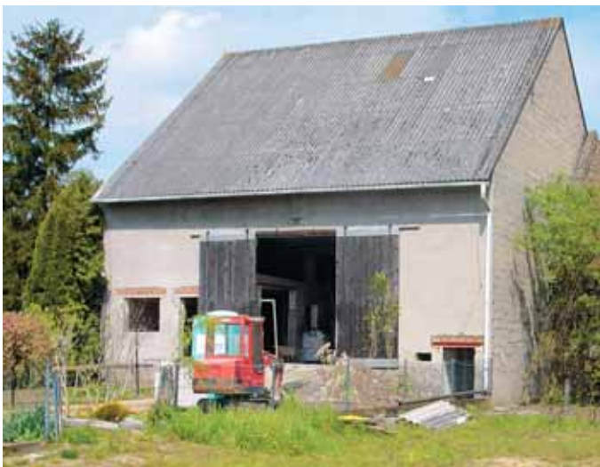
Vorher: Typische landwirtschaftliche Scheune in einem Odenwalddorf

dörflichen Trinkbornschule in Ober-Roden mitbetreut. Die kompetente Umsetzung lebendiger Spannungsbögen in zeitgemäße, schlüssige Konzepte ist auch sonst das Leitmotiv von BJA – sei es als Vermittlung zwischen persönlichen Wünschen und der Rücksicht auf landschaftliches Umfeld oder vorhandene Bebauung, sei es im gekonnten Umgang mit Behördenvorgaben und finanziellen oder zeitlichen Rahmenbedingungen.